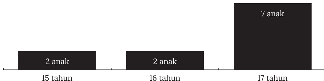
Bagan 2. Usia Anak yang Terlibat Tindak Pidana Terorisme, 2015–2018

Berdasarkan data yang ditunjukkan oleh Grafik 1, YPP juga memberikan keterangan lebih lanjut mengenai usia anak yang terlibat dalam kejahatan terorisme, data tersebut ditunjukkan oleh Bagan 2 (Maknunah, 2019).