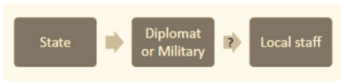
Gambar 4. Extension of Care Model

dan polisi dalam perlindungan, biasanya dalam situasi darurat di mana keadaan negara mitra dalam posisi ketidakstabilan dan tidak ada jaminan keamanan terhadap penduduk asing di suatu negara.