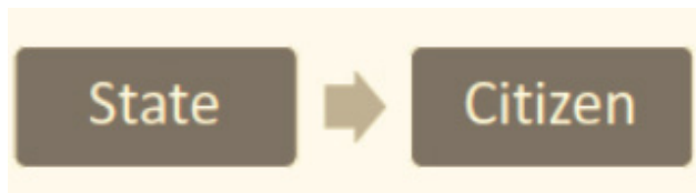
Gambar 2. Social Contract Care Model

memberikan perlindungan kepada warga negaranya di negara lain. Sebagai buku bunga rampai Nina & Wrenn membuat klasifikasi tiga model bagaimana DoC dapat dijalankan oleh negara.